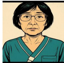
ふじしま 作業療法士