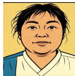
さいしょ 介護福祉士