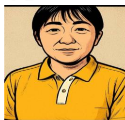
よねだ 作業療法士