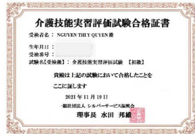
クエン・ティ・イ・クエン