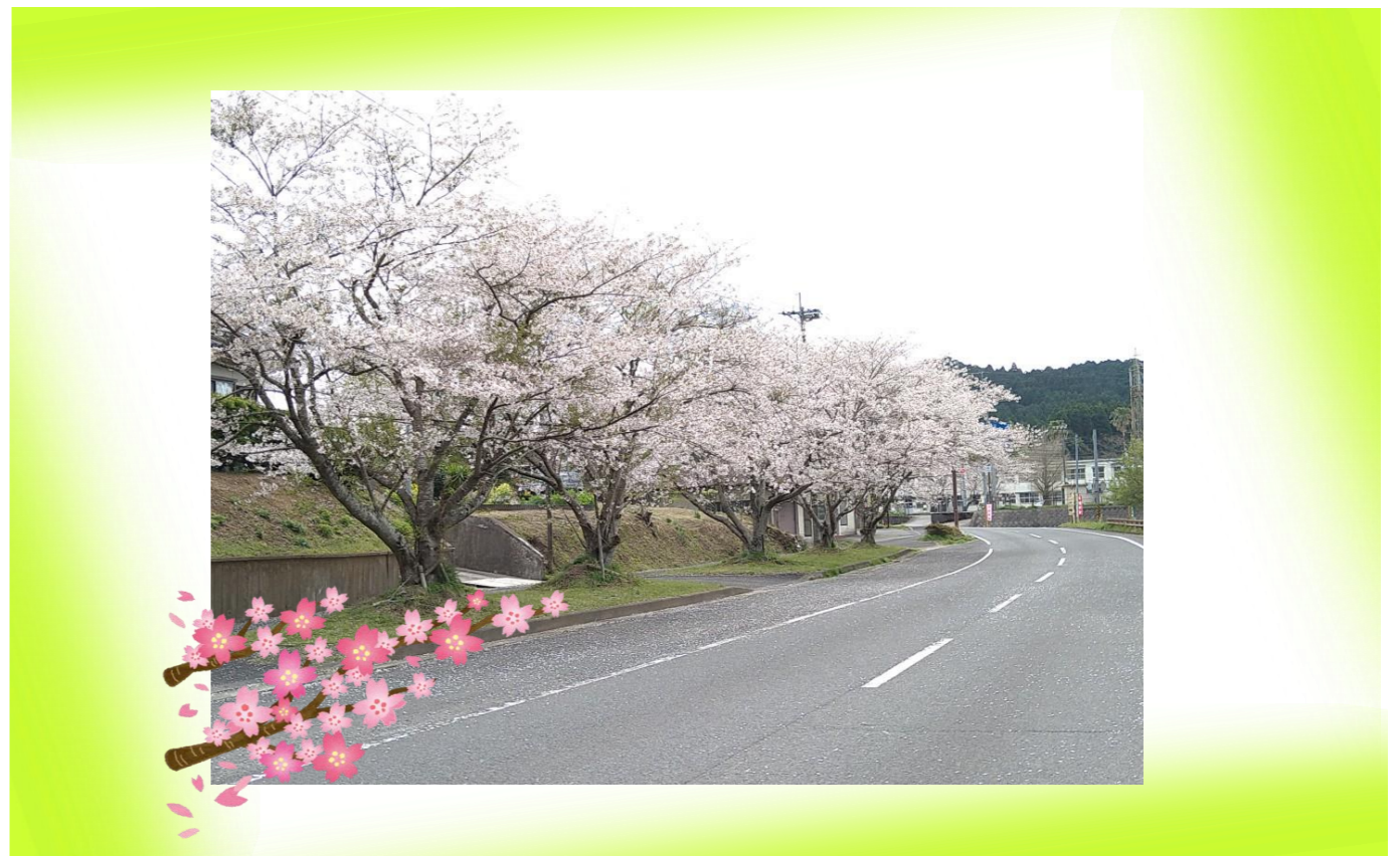
2021.4 南さつま市金峰町大坂にて撮影