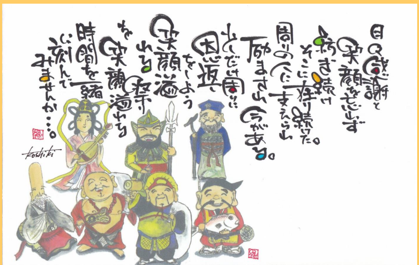
作業療法アーティスト koshiki