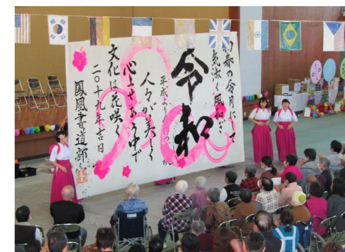
表紙写真：令和元年12月1日 阿多ふれあい祭 鳳凰高等学校書道部皆さんによる「書道パフォーマンス」