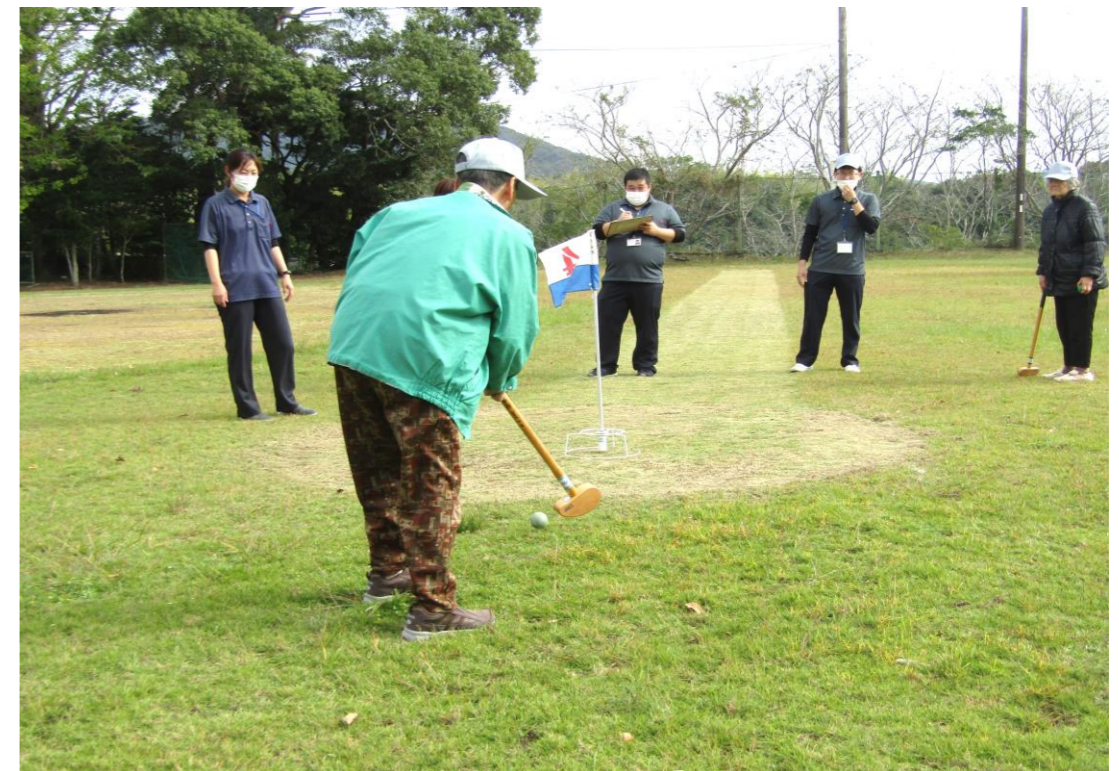
表紙写真：令和2年11月 院内グランドゴルフ大会